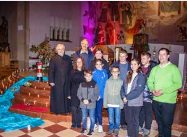
Die „Nacht der 1.000 Lichter“ tauchte unsere Kirche wieder in ein besonderes Licht ein.