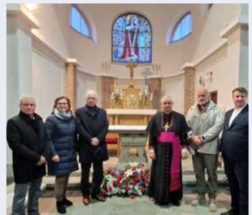
In České Velenice fand die Weihe des neuen Altars und Ambos statt.