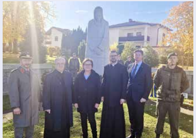
Allerheiligengedenkfeier zu Ehren der Opfer beider Weltkriege beim Kriegerdenkmal.