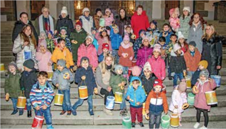
Das Martinsfest des Kindergartens Gmünd-Neustadt führte die Kinder vor die Herz-Jesu-Kirche.